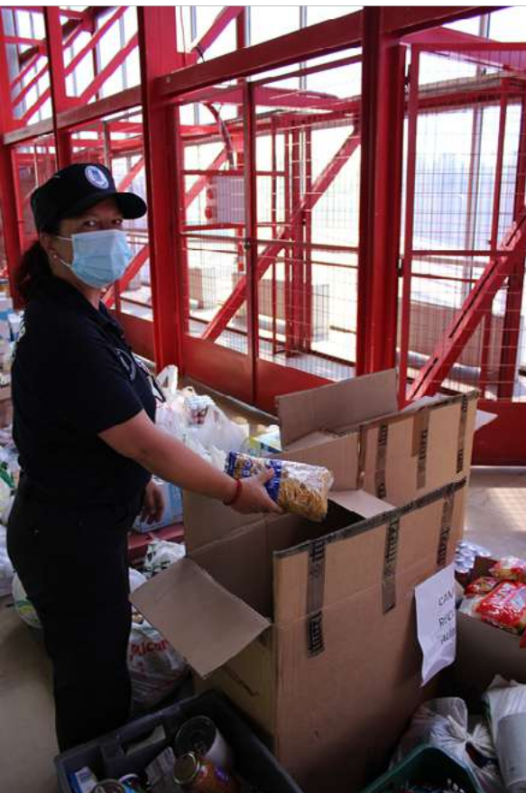
Los auxiliares de Policía Municipal dispusieron los alimentos para su traslado

El presidente del Banco de Alimentos explicó a los asistentes que “el fundamento de su organización es la repartir de alimentos, por eso su principal preocupación es el aprovisionamiento de ellos para poder después distribuir a las personas más desfavorecidas mediante el trabajo de las diferentes entidades” . El presidente siguió destacando “la generosidad de la Policía Municipal, personas entregadas, que se han redoblado en su trabajo durante estos meses, y que han tenido además la generosidad para conseguir todos estos artículos que ahora se entregan al Banco de Alimentos” .