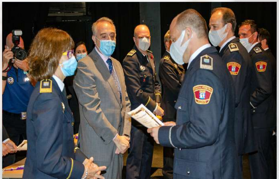
Los nuevos subinspectores reforzarán el servicio de los distritos.

También tuvo un especial recuerdo a las familias de los agentes, y agradeció “el apoyo que han mostrado a los mismos y que ha coincidido con una especial carga de trabajo para el Cuerpo de policía Municipal durante este periodo de pandemia” .