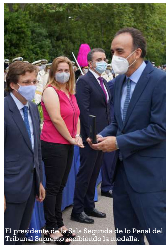
El presidente de la Sala Segunda de lo Penal del Tribunal Supremo recibiendo la medalla.

sanitaria, ha sido el mismo teléfono de ayuda y confianza para el ciudadano”.