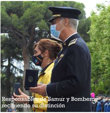
Responsables de Samur y Bomberos recibiendo su distinción

tinguió también el trabajo de los medios de comunicación que, en esta ocasión, fueron representados por el programa Madrid Directo, de Telemadrid, la agencia de noticias Europa Press y el diario ABC. El 092 y la Unidad de Relaciones Institucionales recibieron sendas metopas identificativas de su cincuenta aniversario y la labor de difusión pública de las actuaciones del Cuerpo, respectivamente.