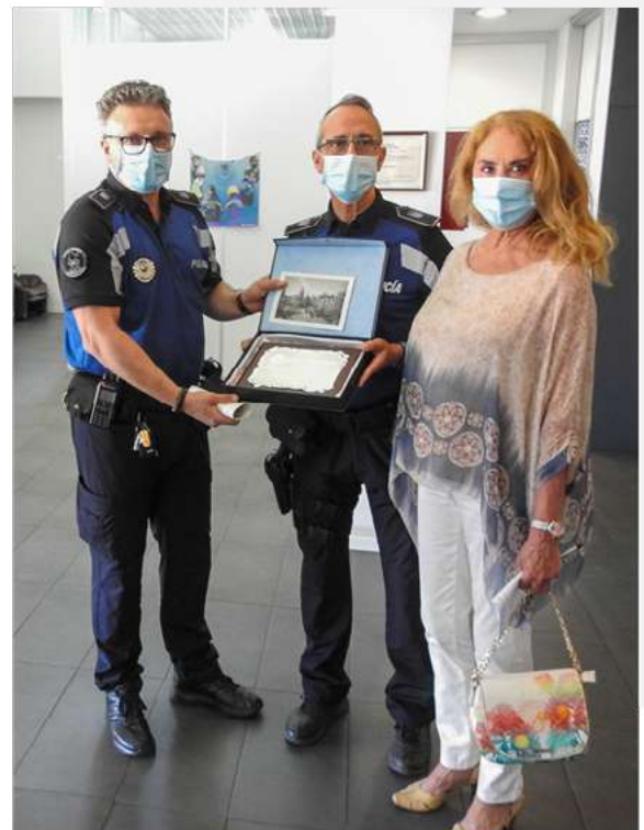
Agentes durante el acto con la metopa recibida.