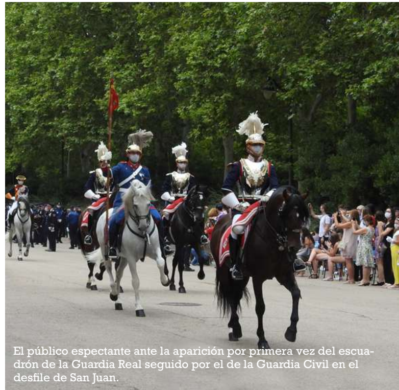
El público espectador ante la aparición por primera vez del escuadrón de la Guardia Real seguido por el de la Guardia Civil en el desfile de San Juan.

Tras ellos, discurrió una muestra de los vehículos de las distintas Unidades, muchos de ellos, no contaminantes, como el Mitsubishi Outlander, ZOE, Toyota Prius-Plus, Seat León TGI de las Unidades Integrales de Distrito , o las motocicletas ZERO FX6.5 de la Unidad de Medio Ambiente . También pudieron ser vistas las scooter Piaggio MP3 destinadas a los distritos y motocicletas de alta cilindrada BMW RT1200 de la Unidad Especial de Tráfico , encargadas de servicios de escolta, o desplegadas en servicios extraordinarios de tráfico, y de la seguridad vial en la Calle 30. En el desfile, fue estrenada la nueva imagen corporativa de los vehículos utilizados por los equipos de la UAS .