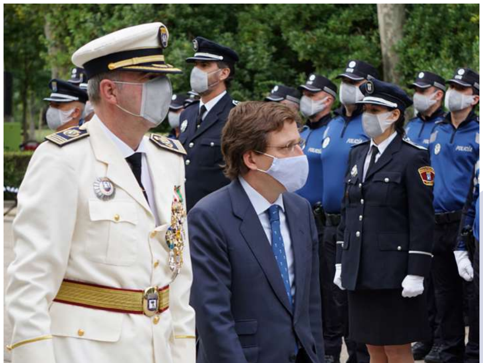
El alcalde acompañado por el comisario general pasando revista

Homenaje por su trabajo en la lucha contra la pandemia