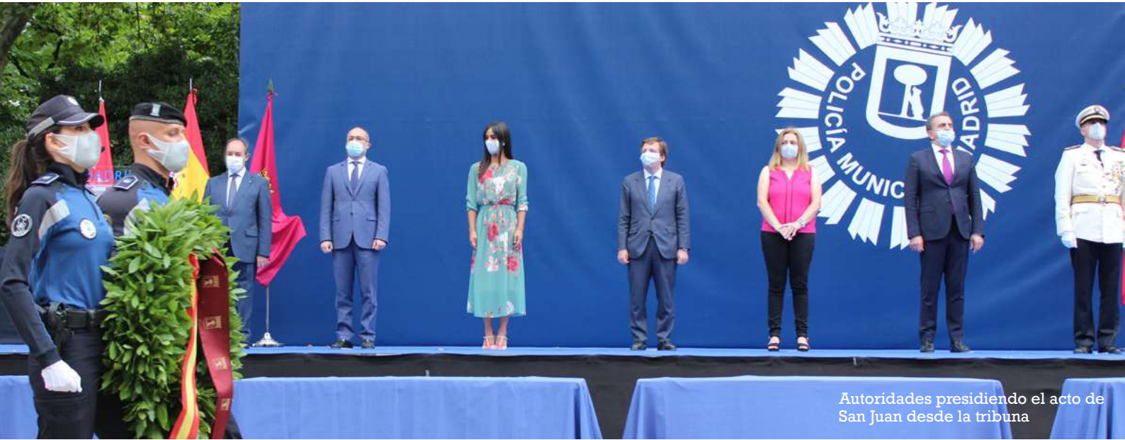
Autoridades presidiendo el acto de San Juan desde la tribuna