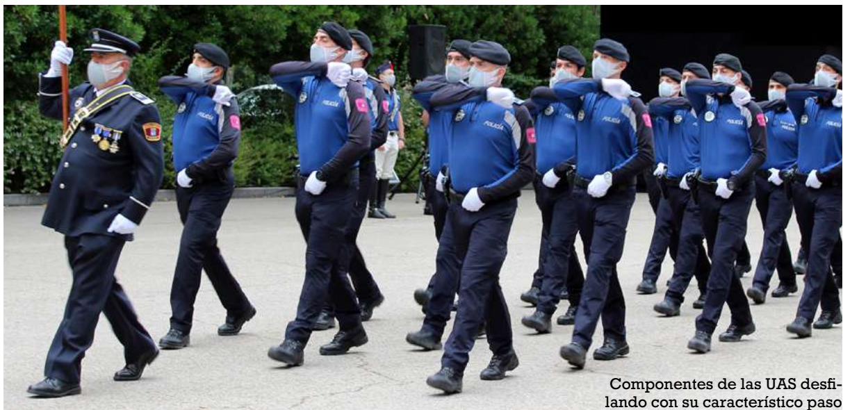
Componentes de las UAS desfilando con su característico paso