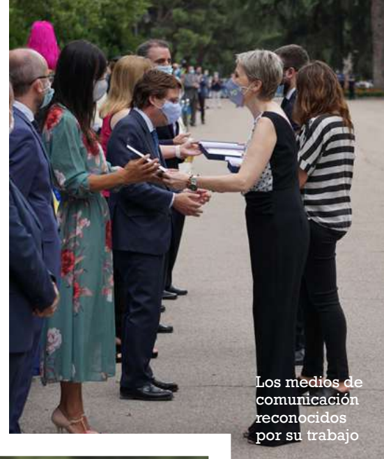
Los medios de comunicación reconocidos por su trabajo

tinguió también el trabajo de los medios de comunicación que, en esta ocasión, fueron representados por el programa Madrid Directo, de Telemadrid, la agencia de noticias Europa Press y el diario ABC. El 092 y la Unidad de Relaciones Institucionales recibieron sendas metopas identificativas de su cincuenta aniversario y la labor de difusión pública de las actuaciones del Cuerpo, respectivamente.