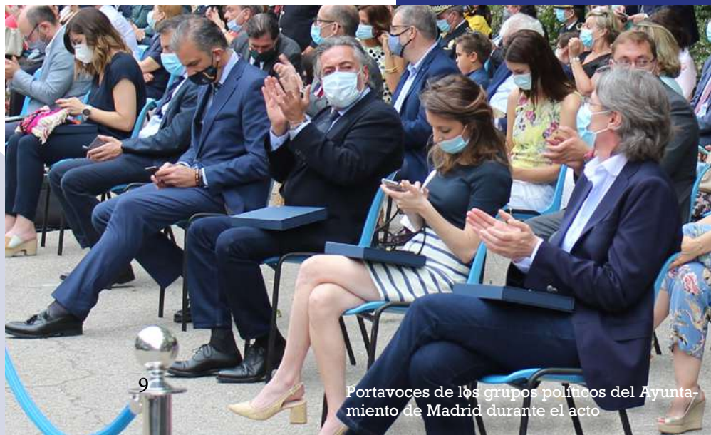
Portavoces de los grupos políticos del Ayuntamiento de Madrid durante el acto